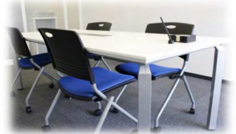
【相談ブース (イメージ)】