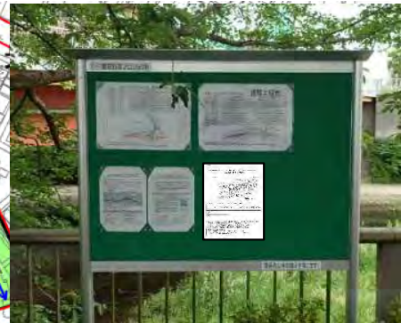
掲示板設置イメージ